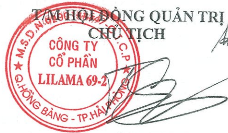
Trương Đức Thành